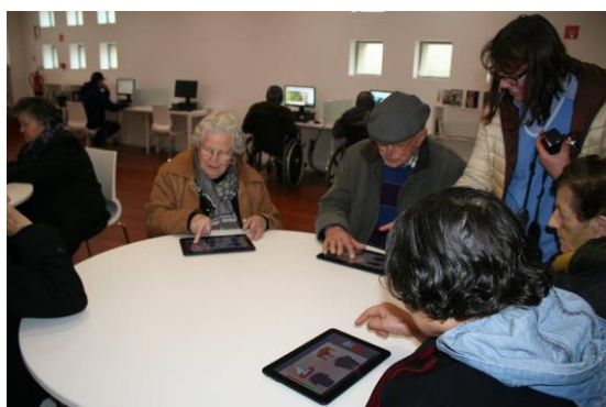
Universidade Sénior no Museu