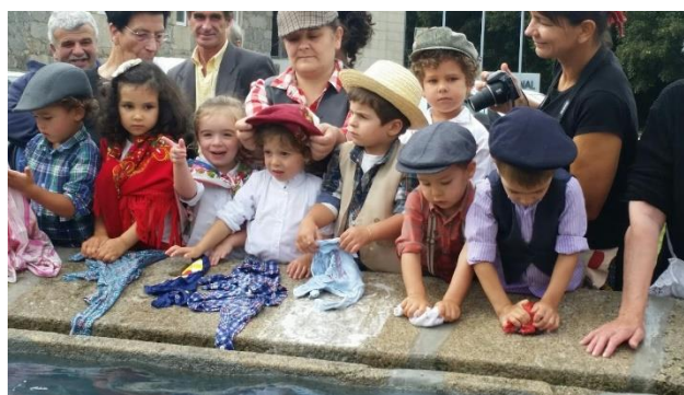
Atividades no Museu